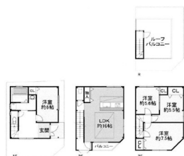
【間取り】LDK16帖以上になっており、4LDKで部屋数も多いです。

コメント 閑静な環境に佇む、通風良好な4LDK中古住宅。家族の会話が増えるカウンターキッチンを採用した、使い勝手の良い間取りです。 【期間限定・限定販売】につき、この機会をお見逃しなく。 間取 4LDK ●延床面積 100.78㎡ (30.48坪) ●築年月 2002年11月 設備 ユニットバス(11坪サイズ)、システムキッチン、対面キッチン、扉上バルコニー 周辺情報 摂津市立鳥飼小学校 1100m 摂津市第二中学校 1400m ファミリーレストラン 1200m セブンイレブン摂津東一ツ屋店 700m