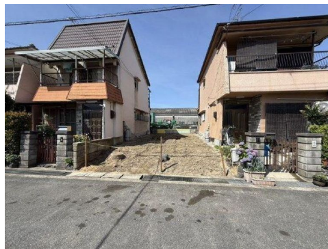
約22.0坪の整形地 建築条件なし 前面道路約7.6m