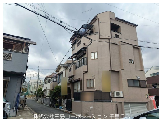
株式会社三島コーポレーション 千里丘店