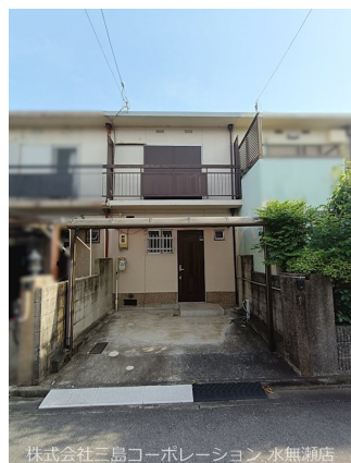
株式会社三島コーポレーション 水無瀬店