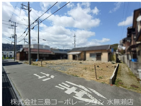
株式会社三島コーポレーション 水無瀬店