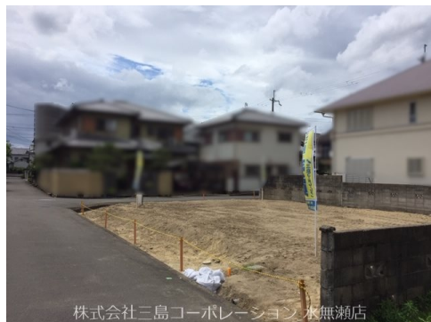
株式会社三島コーポレーション 水無瀬店