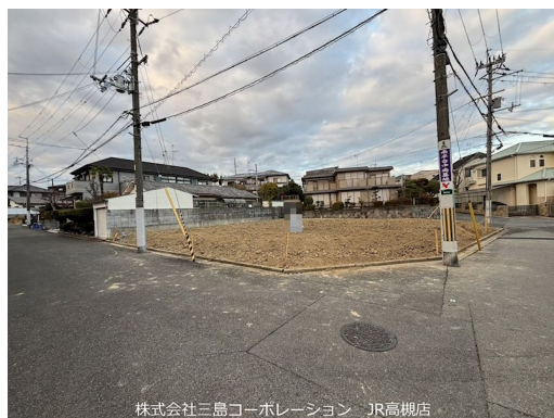
株式会社三島コーポレーション JR高槻店