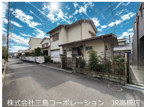
株式会社三島コーポレーション JR高槻店