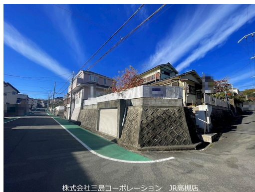
株式会社三島コーポレーション JR高槻店