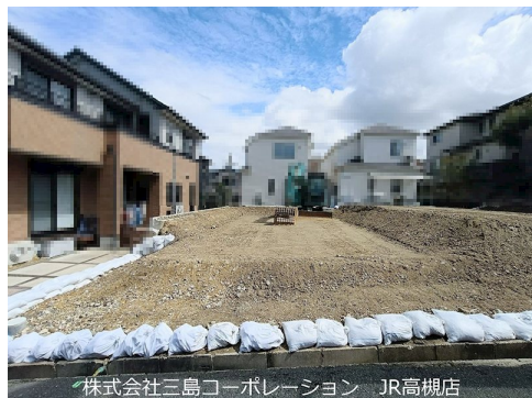
株式会社三島コーポレーション JR高槻店