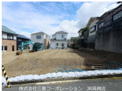
株式会社三島コーポレーション JR高槻店