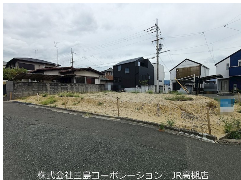
株式会社三島コーポレーション JR高槻店