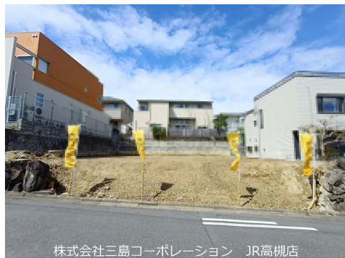
株式会社三島コーポレーション JR高槻店