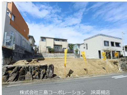
株式会社三島コーポレーション JR高槻店