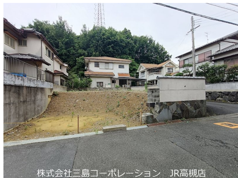
株式会社三島コーポレーション JR高槻店