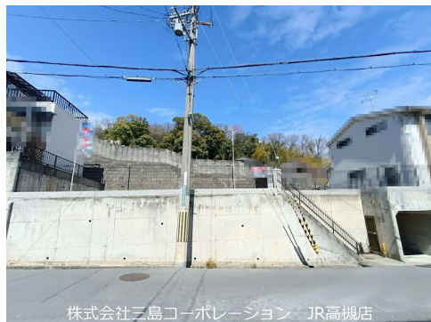
株式会社三島コーポレーション JR高槻店