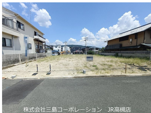
株式会社三島コーポレーション JR高槻店