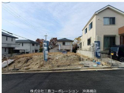
株式会社三島コーポレーション JR高槻店