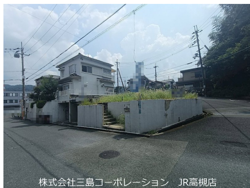
株式会社三島コーポレーション JR高槻店