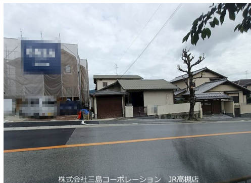
株式会社三島コーポレーション JR高槻店