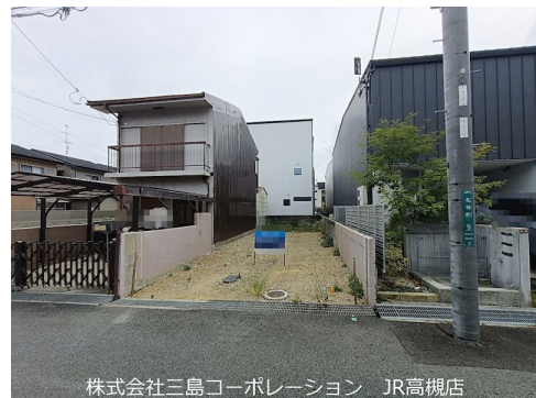
株式会社三島コーポレーション JR高槻店