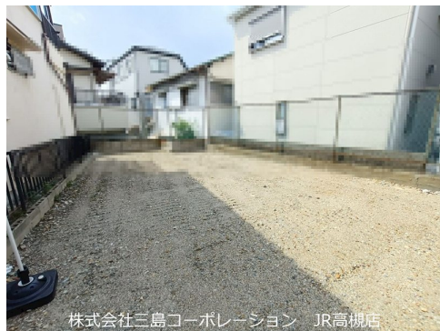
株式会社三島コーポレーション JR高槻店