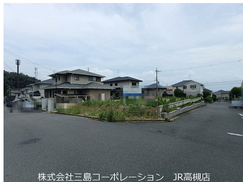
株式会社三島コーポレーション JR高槻店