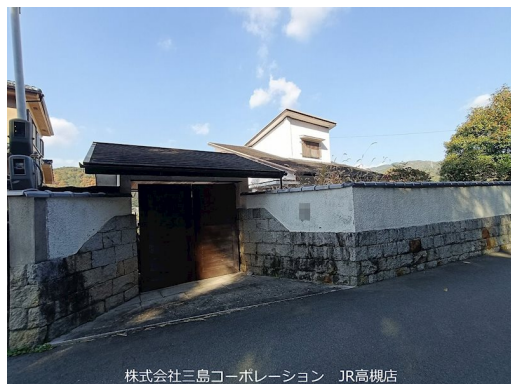
株式会社三島コーポレーション JR高槻店