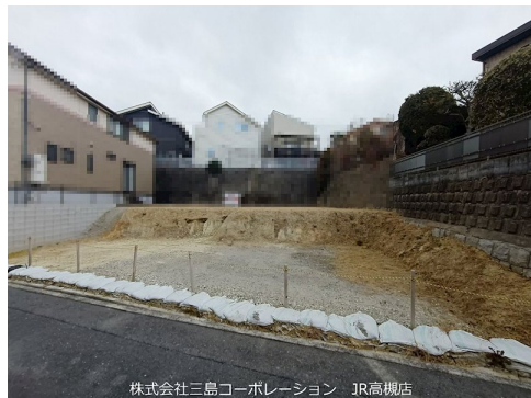
株式会社三島コーポレーション JR高槻店