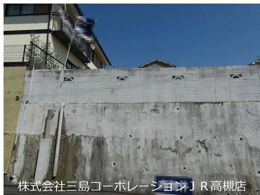
株式会社三島コーポレーション J R 高槻店