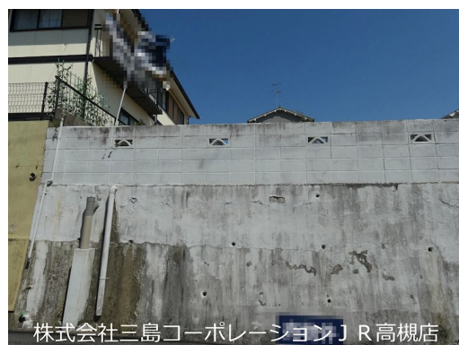
株式会社三島コーポレーション J R 高槻店