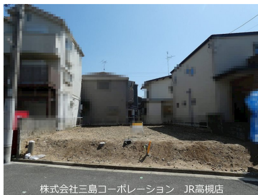
株式会社三島コーポレーション JR高槻店