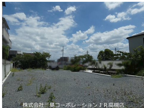
株式会社三島コーポレーション J R 高槻店