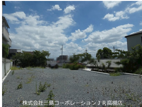
株式会社三島コーポレーション J R高槻店