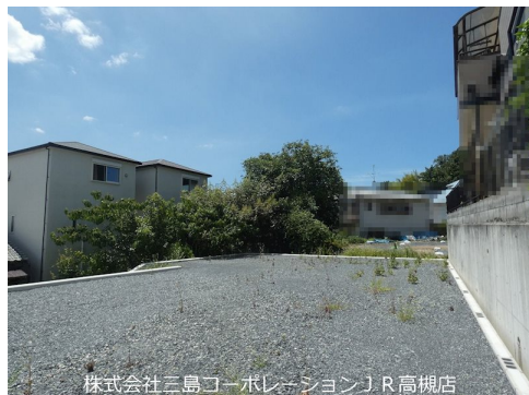
株式会社三島コーポレーション J R 高槻店