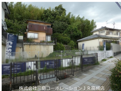
株式会社三島コーポレーション J R 高槻店