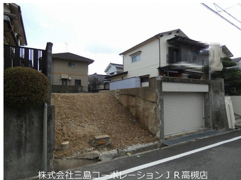
株式会社三島コーポレーション J R 高槻店