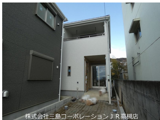
株式会社三島コーポレーション J R 高槻店