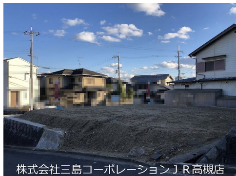
株式会社三島コーポレーション J R高槻店