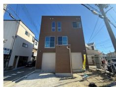
インナーガレージ部分はロードサイドにて店舗や事務所としても検討出来ます。