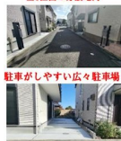
駐車しやすい広々駐車場