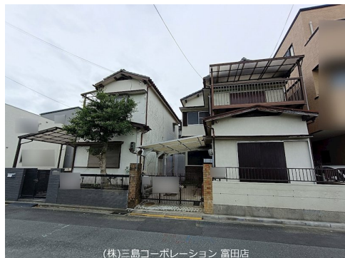
(株)三島コーポレーション 富田店