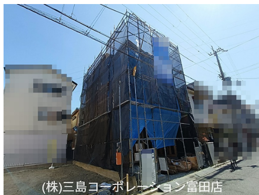
(株)三島コーポレーション 富田店