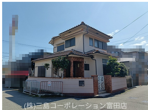
(株)三島コーポレーション富田店