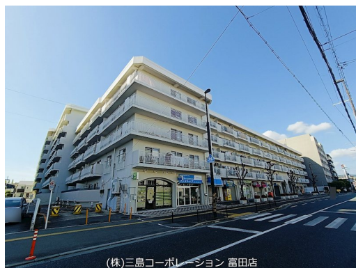
(株)三島コーポレーション 富田店