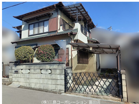
(株)三島コーポレーション 富田店