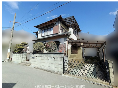
(株)三島コーポレーション 富田店