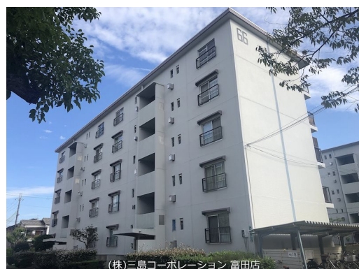
(株)三島コーポレーション 富田店