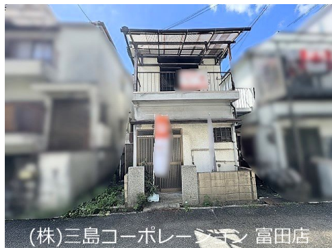
(株)三島コーポレーション 富田店