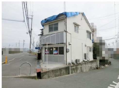
東海道本線 摂津富田駅 徒歩16分